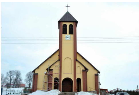
Kościół p.w. bł. Bolesławy Lament w Nidzicy.