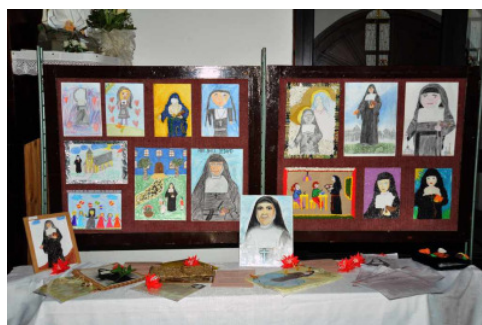
Wystawa prac konkursowych w kościele p.w. bł. Bolesławy w Nidzicy.